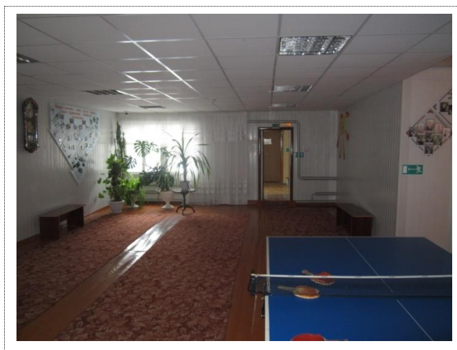
Фото №3 – Коридор