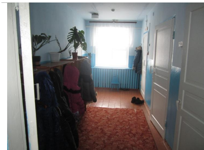
Фото №3 – Коридор