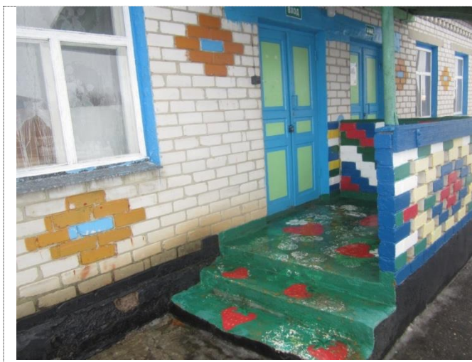
Фото №2 – Вход в здание