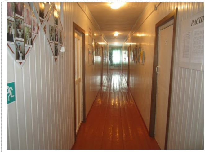
Фото №3 – Коридор