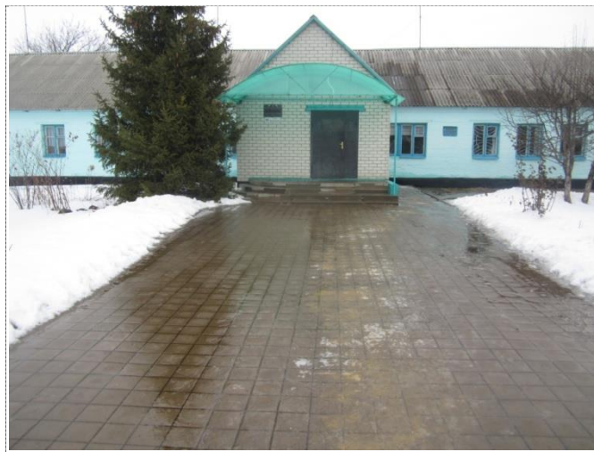
Фото №1 – Вход на территорию