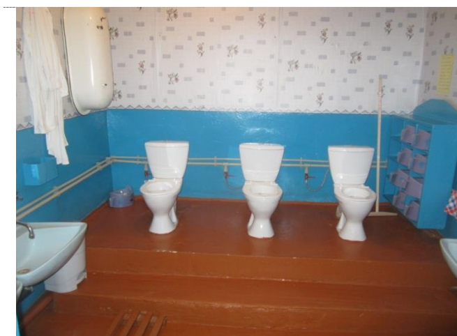
Фото № 6 – Санитарно-гигиенические помещения (туалет в дошкольной группе)