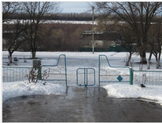
Фото №1 – Вход на территорию