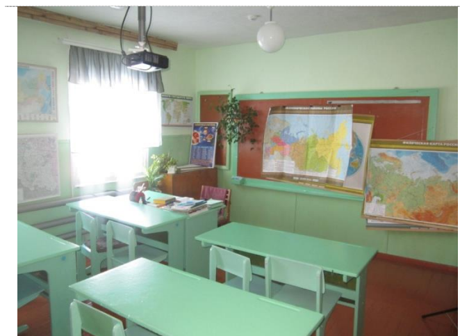
Фото №4 – Зона оказания услуг кабинетная форма)