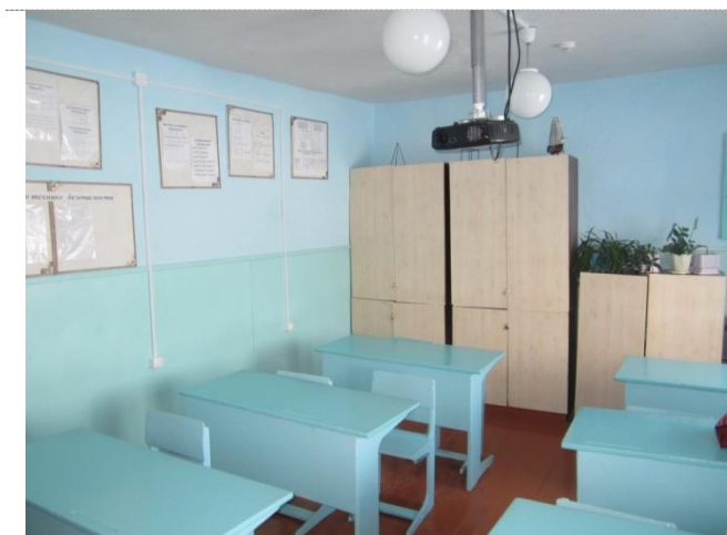
Фото №4 – Зона оказания услуг кабинетная форма)