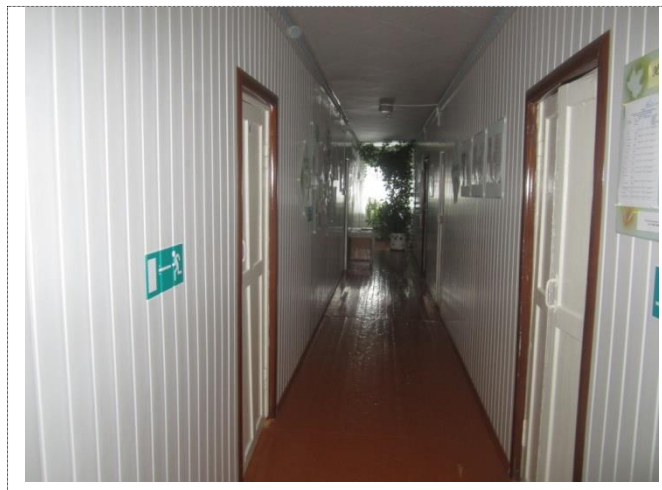
Фото №3 – Коридор