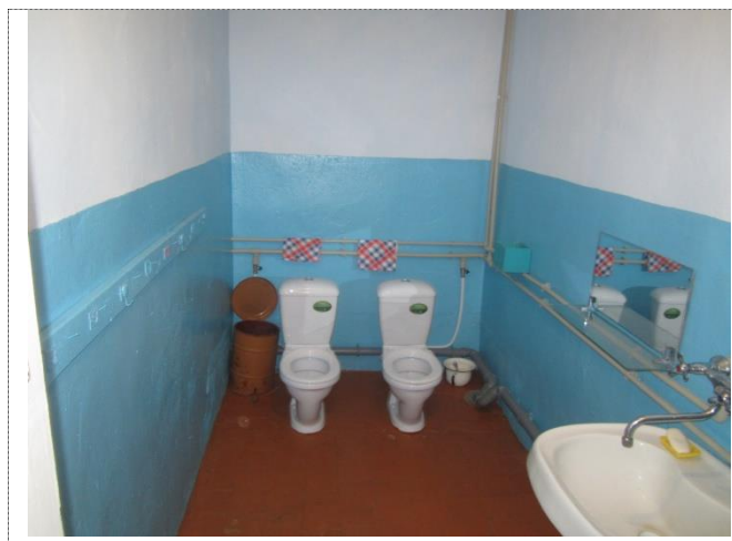
Фото №5 – Санитарно-гигиенические помещения (мужской туалет)