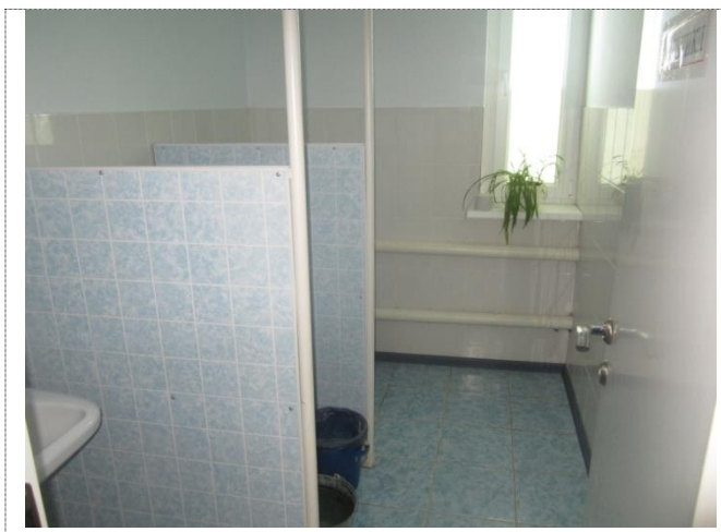
Фото №5 – Санитарно-гигиенические помещения (женский туалет)