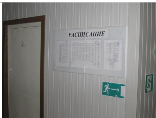
Фото №7 – Система информации на объекте