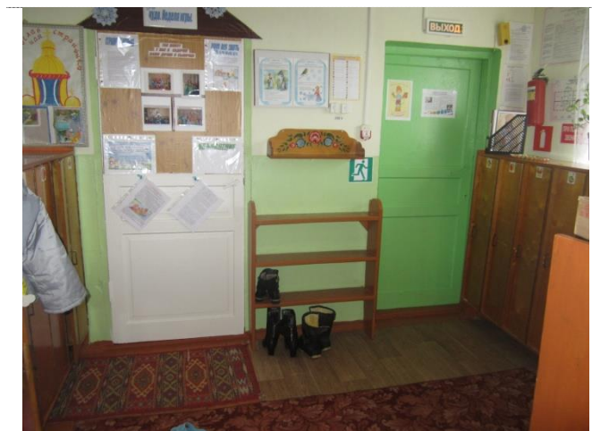
Фото №3 – Коридор