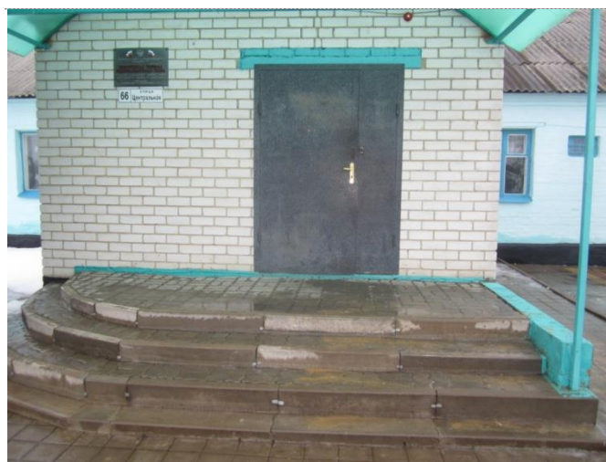
Фото №2 – Вход (главный) в здание