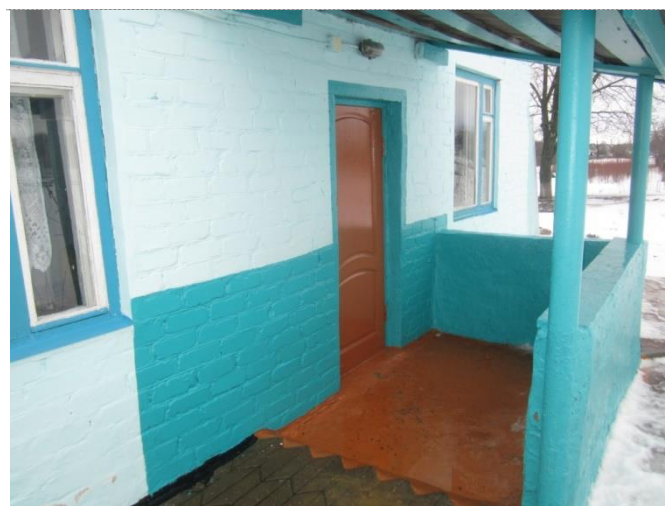
Фото №2 – Вход № 2 в здание